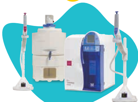
Milli-Q Integral MT